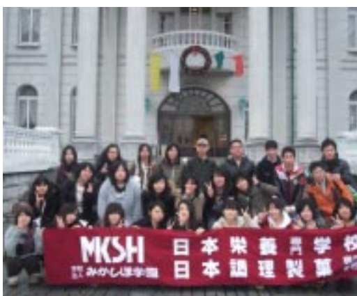
お菓子のお城の玄関にて

日本調理製菓専門学校は、12月 3日・4日に一泊二日の日程で、課 外研修に行きました。楽しく、かつ 有意義に過ごした二日間は学生時 代の大切な思い出となったこと でしょう。