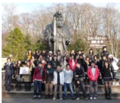
しらおいポロトコタンにて

日本栄養専門学校は、12月2日か ら3日間、北海道へ課外研修にい きました。楽しく、かつ有意義な研 修になりました。