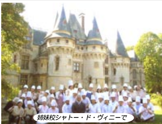
姉妹校シャトー・ド・ヴィニーで